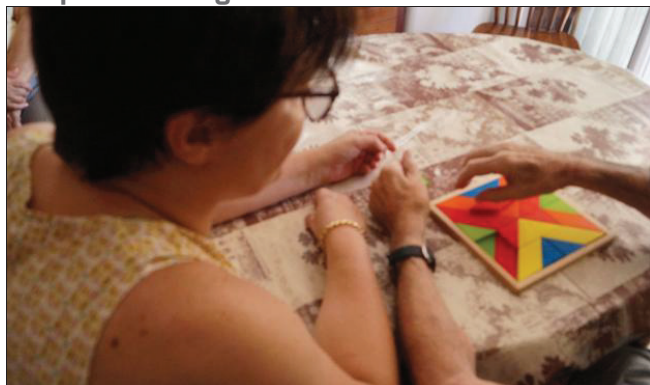
■ La Mutualité française est à l'origine de ces actions de sensibilisation dans tous les départements auvergnats.

Un spectacle de débat théâtral intitulé Du côté de la vie , sous forme de petites saunètes, sera joué par la compagnie Entrées de jeu et proposé par la Mutualité française Auvergne. L'objectif est d'interpeller le public sur le bien-être et le maintien des personnes âgées à domicile. Il se déroulera mardi 4 octobre, à partir de 14 heures, à l'Espace culturel du Monteil.