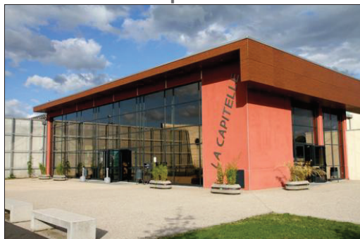
■ Outre les apéros du jeudi et différentes soirées à thème, le cinéma La Capitelle a aussi pensé aux aînés.

C'est la nouveauté de cette rentrée au cinéma La Capitelle. L'équipe municipale propose un rendez-vous mensuel aux seniors. L'idée est de prolonger la séance de cinéma autour d'un café. À noter sur les agendas, à la date du mercredi 28 septembre à 15 heures, après le film Radin avec Dany Boon : une collation pour prolonger cette agréable sortie au Mazel.